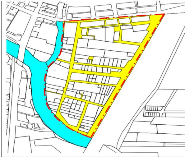
Rajah 1.1 Pelan Tapak

ini dikelilingi semak samun dan mempunyai aliran sungai dari sungai Kedah.