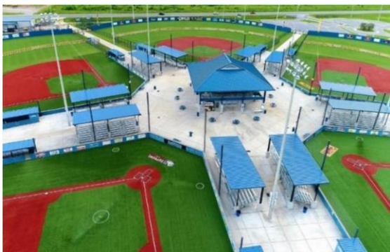
Rajah 1.8 Cadangan mini Kompleks Pusat Sukan Belia

Cadangan yang pertama adalah untuk membangunkan semula kawasan Tanjung Bendahara selain meningkatkan interaksi sosial dalam kalangan masyarakat dan untuk membangunkan kemudahan bersukan bagi golongan remaja. Sukan menjadi wadah terbaik untuk memupuk dan menyemarakkan semangat perpaduan dalam kalangan rakyat pelbagai kaum. Hal ini penting untuk melahirkan masyarakat majmuk di Malaysia. Memandangkan kawasan Tanjung Bendahara ini berhampiran dengan Stesen Kereta api Tanah Melayu (KTM) ianya memudahkan setiap pengunjung untuk ke kawasan Pusat sukan belia ini.