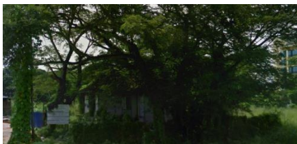
Rajah 1.5 Kawasan Semak Samun

Kawasan persekitaran yang dipenuhi semak samun akibat kawasan brownfield. Kawasan tersebut dipenuhi pokok pokok besar, pokok menjalar dan lalang. Kawasan yang kelihatan suram akibat persekitaran yang tidak tersusun dan teratur