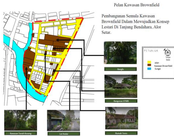
Rajah 1.4 Analisis Kawasan Brownfield

Kawasan persekitaran yang dipenuhi semak samun akibat kawasan brownfield. Kawasan tersebut dipenuhi pokok pokok besar, pokok menjalar dan lalang. Kawasan yang kelihatan suram akibat persekitaran yang tidak tersusun dan teratur