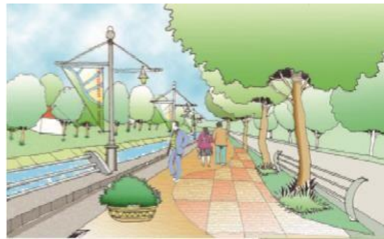
Rajah 1.9 ilustrasi di atas adalah aktiviti kawasan rekreasi di Sungai Kedah

Kawasan rekreasi yang dicadangkan adalah di kawasan pesisiran Sungai Kedah. Penyediaan landskap di kawasan rekreasi dapat mewujudkan kualiti keindahan kawasan rekreasi dan sekaligus membentuk identiti serta imej kawasan tersebut. Kegunaan landskap lembut perlu diintegrasikan dengan penggunaan landskap kejur di mana rekabentuknya yang tersendiri dapat membentuk imej kawasan rekreasi antaranya adalah pasu bunga, siar kaki, lampu hiasan di laluan pejalan kaki dan tempat duduk awam.